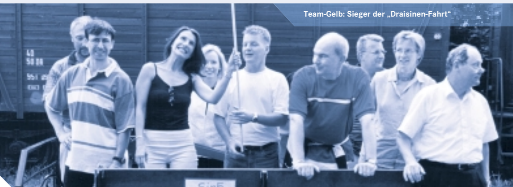
Team-Gelb: Sieger der „Draisinen-Fahrt“

Ihre sportliche Kompetenz bewiesen die Teilnehmer beim Get Together am Abend. G&H veranstaltete als besondere Einlage ein „Draisinen-Fahren“ am Rande Berlins. Fünf Teams mussten bei 30°C ihr prosaisches Können unter Beweis stellen, einen Überfall abwehren und ihr Schienengefährt in einem Zeitfahren sicher ins Ziel nach Töpchin-Hauptbahnhof bringen. Ein „Riesenspaß“, darin waren sich alle Teilnehmer einig. Der nächste Kundentag findet am 22.02.2002 statt.